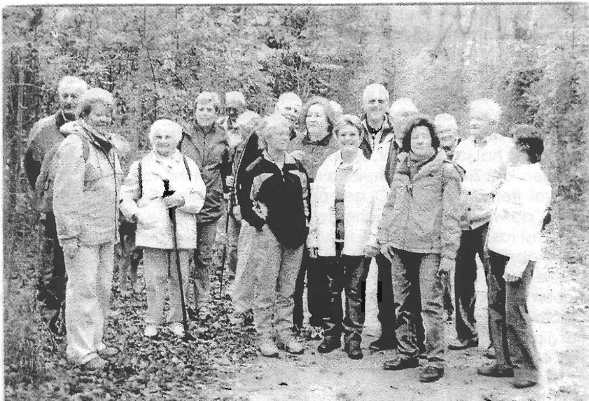
Vereins Herbstwanderung am 26. Oktober 2006 in die Freudenau Kurze Rast